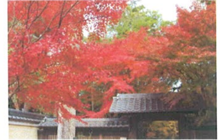
大晦日・お七夜の本山