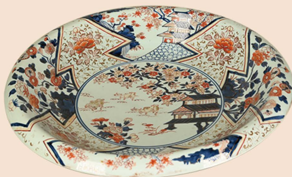
色絵菱割楼閣山水文大皿（専修寺蔵）