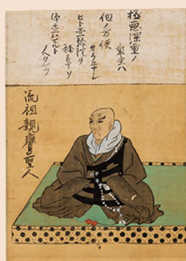
親鸞聖人像（円超上人筆・専修寺蔵）