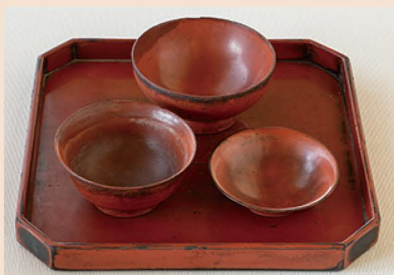
真慧上人の大飯茶碗（浄光寺蔵）