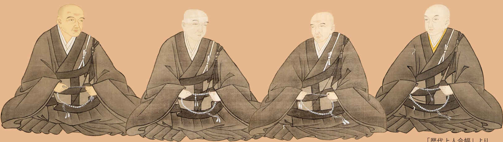
「歴代上人合幅」より