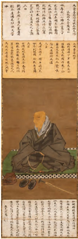
開山大師御自画像(安城御影・親鸞聖人像)